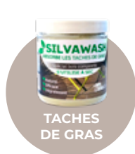
TACHES DE GRAS