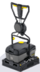
40/10 C ou équivalent

La terrasse doit impérativement être lavée au minimum une fois par an, idéalement au printemps. Un second lavage à l'automne / en fin de saison est également recommandé afin de limiter l'encrassement et faciliter le nettoyage de printemps.