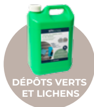
DÉPÔTS VERTS ET LICHENS